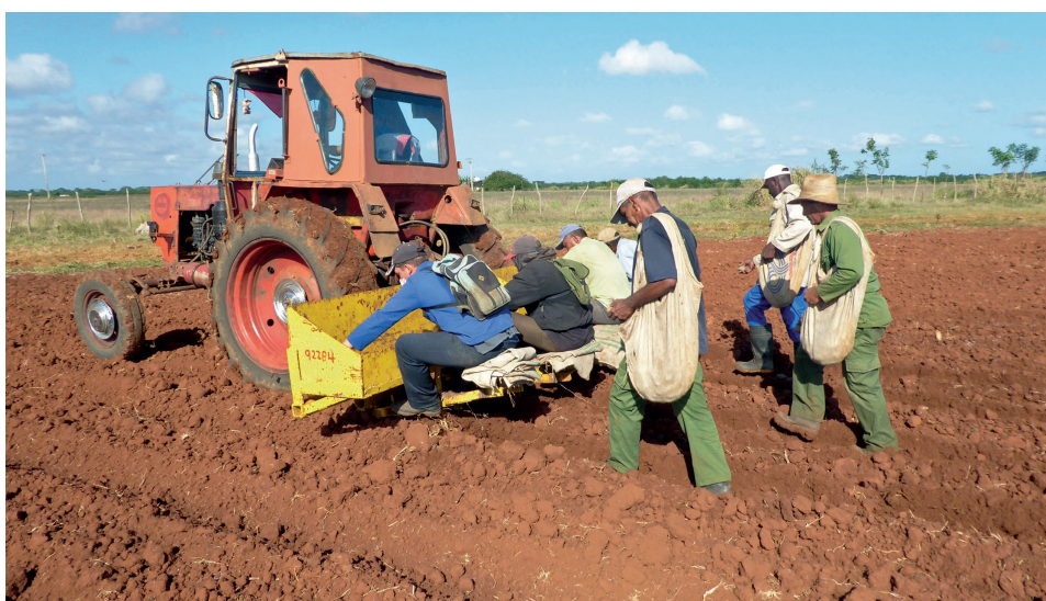
La papa plantada estará lista para su cosecha en marzo.

Todo un mentís a quienes afirmaron que a Horquita no le iba a ser fácil recuperarse del castigo de "Eta" sobre unas 900 hectáreas de sus tierras cultivables.