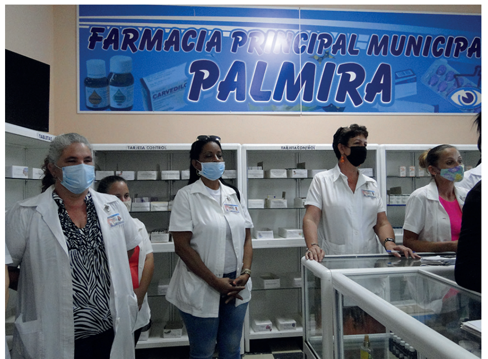
Quedó reparada la Farmacia Principal de Palmira.

Palmira y Cienfuegos se sumaron al jubileo de enero con la inauguración de obras de importancia social. Así quedó reparada en la localidad palmireña la Farmacia Principal, de la calle Portela.